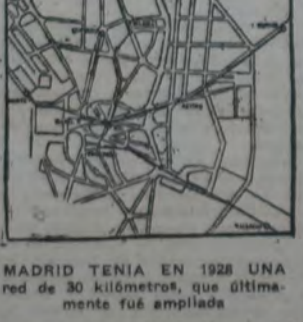
MADRID TENIA EN 1928 UNA red de 30 kilómetros, que últimamente fué ampliada

Esto quiere decir que el valor de la tarifa del viaje directo en relación al salario por hora es muy superior en Buenos Aires, con respecto al mismo valor en Nueva York y París, o inferior a Berlín y Londres.