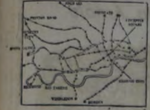
EN LAS 30.000 HECTAREAS DE SUPERFICIE, Londres alberga a 4,5 millones de habitantes. Posee una red subterránea de 200 kilómetros

(1) Tarifa tranviario. (2) Tarifa ferroviaria.