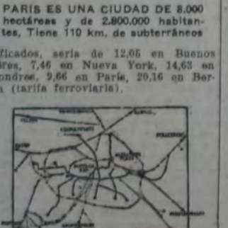
PARIS ES UNA CIUDAD DE 8.000 hectáreas y de 2.800.000 habitantes. Tiene 110 kms. de subterráneos

Puede bien, la relación porcentual entre el costo del viaje directo y el salario horario medio de los obreros calificados, sería de 12,06 en Buenos Aires, 7,46 en Nueva York, 14,63 en Londres, 9,66 en París, 20,16 en Berlín (tarifa ferroviaria).