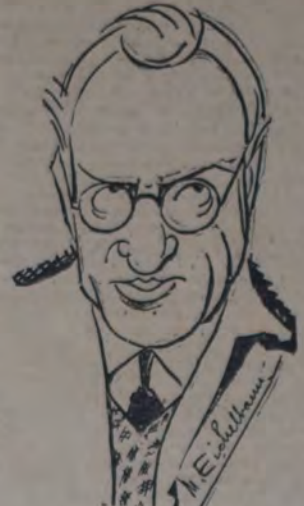
OLIVAN, por Manuel Eichbaum

—¿Le gusta de ésto, don Carolino? El buen milanés levanta su diestra, moviéndola rítmicamente... —¿Quiere otra cosa, entonces? Identica respuesta. El acopiador, resignado, le ofrece un cigarrillo... Don Carolino apela a su ancha faja colorada... extras su medio metro de pipa... su tabaquera de escuerzo... Silencio. Silencio... El comerciante prende un fósforo... (No se oye ni el vuelo de una mosca). —Doce con quince... ¿Quiere, o no? Don Carolino toma el fósforo, parsimoniosamente... Arroja el humo de una magnífica pirata epideica... —Ma... no. Se levanta despacito. Y se va. Se va, no más... El almacenero se tira de los cables, porque, como ha sucedido en otras ocasiones, a lo mejor un colega suyo, cualquiera, que da con el colono por la calle, ofrece menos y se alza con la cosecha de don Carolino. ¡Si al fin y al cabo el mis-